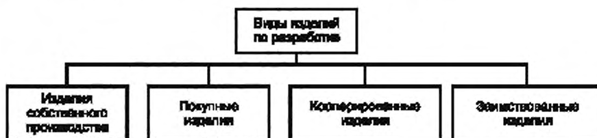
Рисунок А.3 — Виды изделий по разработке

А.3 Виды и структура изделий по разработке приведены на рисунке А.3.