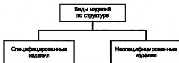
Рисунок А4 — Виды изделий по структуре

А.4 Виды и структура изделий по структуре приведены на рисунке А.4.