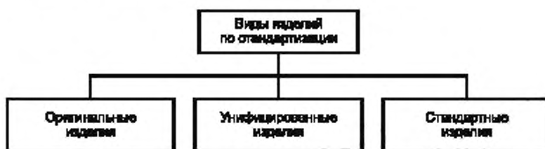
Рисунок А.5 — Виды изделий по стандартизации

А.5 Виды изделий по уровню стандартизации приведены на рисунке А.5.