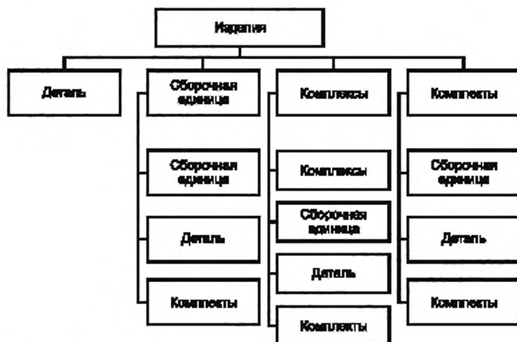
Рисунок А.1 — Виды и структура изделий по конструктивно-функциональным характеристикам

А.1 Схема видов изделий по конструктивно-функциональным характеристикам и их структура приведены на рисунке А.1.